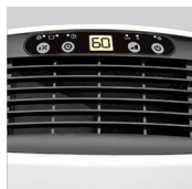
Nadzorna plošča Prikaz indikatorja vlažnosti.