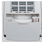
Odstranljiv rezervoar za vodo.