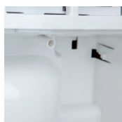
Naprava za neprekinjeno odvajanje vode.