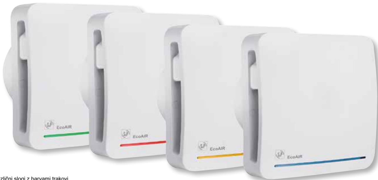
Različni slogi z barvami trakovi