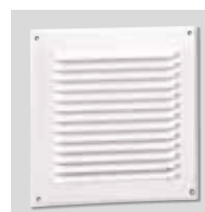
GRA-75 Aluminijasta rešetka.