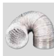
GSA-100 Gibljiv aluminijast kanal.