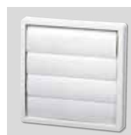
PER-100W Protipovratna rešetka